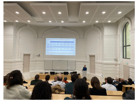
Présentation lors de la 6 e journée RESO Bordeaux

Le jeudi 13 mars 2025, la 6 e Journée du Centre de Référence des Maladies Auto-Immunes Systémiques et Auto-Inflammatoires Rares du Sud-Ouest (RESO Bordeaux) s'est déroulée avec succès. Comme chaque année, cet événement a été consacré aux avancées de la recherche clinique et translationnelle, offrant un cadre privilégié d'échange entre experts.